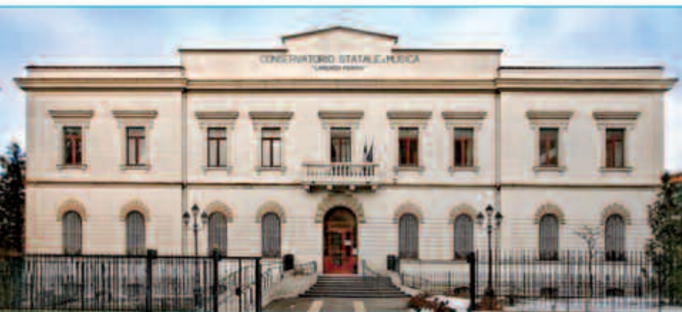
Conservatorio di Musica "L. Perosi" - Campobasso