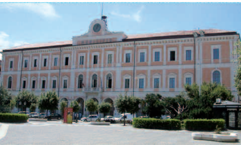
Palazzo S. Giorgio - Municipio - Campobasso